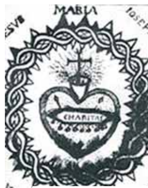
Dibujo realizado por Santa Margarita